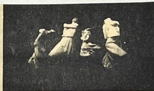
GRUPO DE DANÇA CISNE NEGRO

No seu quinto ano com muita atividade, o Grupo de Dança Cisne Negro continua em seu propósito desenvolver a arte da dança propor